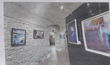
Bougé, macro, noir et blanc, photo animalière... La diversité des points de vue confrontée au regard des visiteurs

Tous les jours de 10 h à 12 h et de 14 h 30 à 19 h, jusqu'au 22 août. Entrée libre. Pour adhésion ou renseignements : 06 82 55 03 01.